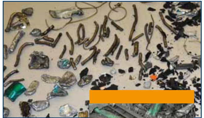
Tonerkartuschen Toner cartridges