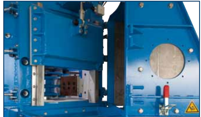
Große Austragsöffnung = grobes Material Wide outlet opening = coarse material