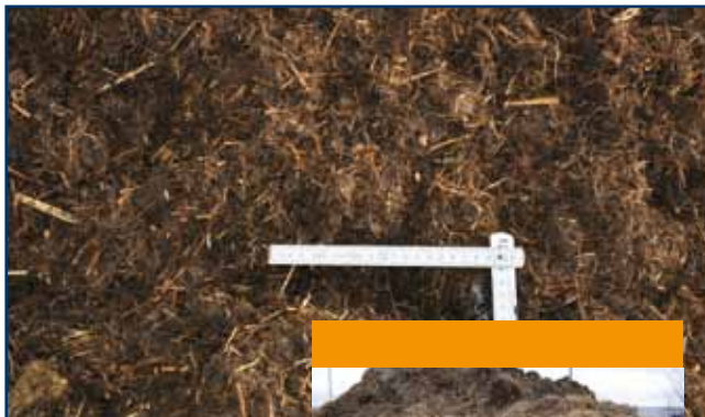
Festmist Solid dung