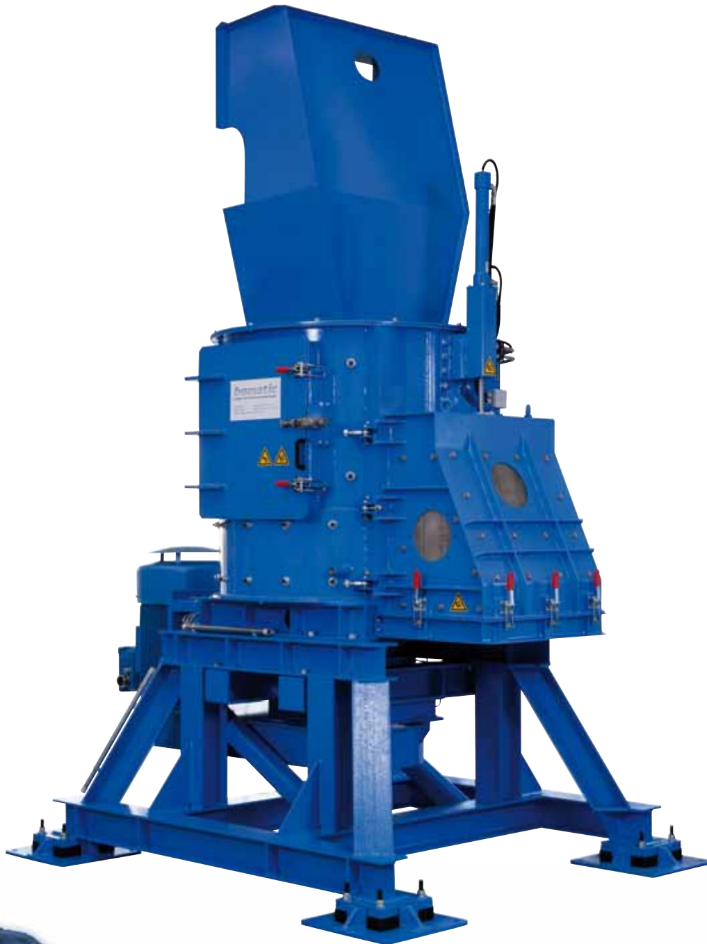
bomatic® R 1200

Great at breaking and shredding: Vertical Shredder from the Rotacrex series