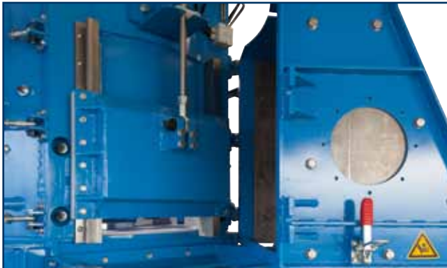
Geringe Austragsöffnung = feines Material Small outlet opening = fine material