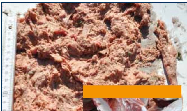
Schlachthofabfälle Slaughterhouse waste