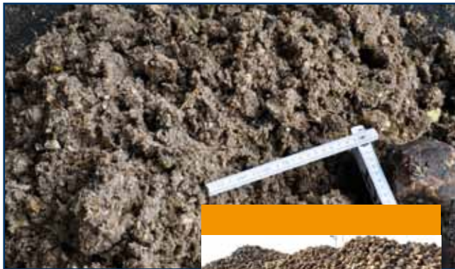
Zuckerrüben Sugar beets