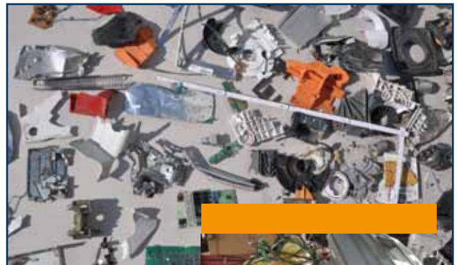
Elektronikschrott Electronic waste